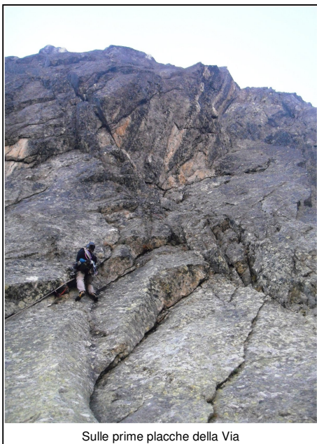
Sulle prime placche della Via

Da Malga Sorgazza seguire la strada bianca (sentiero 327) in direzione Cima d'Asta per circa 20 minuti; arrivati alle indicazioni sulla sx per la Val Vendrame / Forcella delle Buse Todesche, imboccare il sentiero 360 e salire per circa 60 min. Giunti in vista dell'ampio catino alla base delle Pale di Segura (poco prima del grande masso con indicazione su vernice per Malga Sorgazza), abbandonare il sentiero e puntare a sx; dall'ampia conca alla base delle Pale, per tracce (ometti) risalire il pendio per circa 25 minuti puntando verso la cengia in cima allo zoccolo erboso alla base della II° Pala (vicino all'intaglio con la III° Pala).