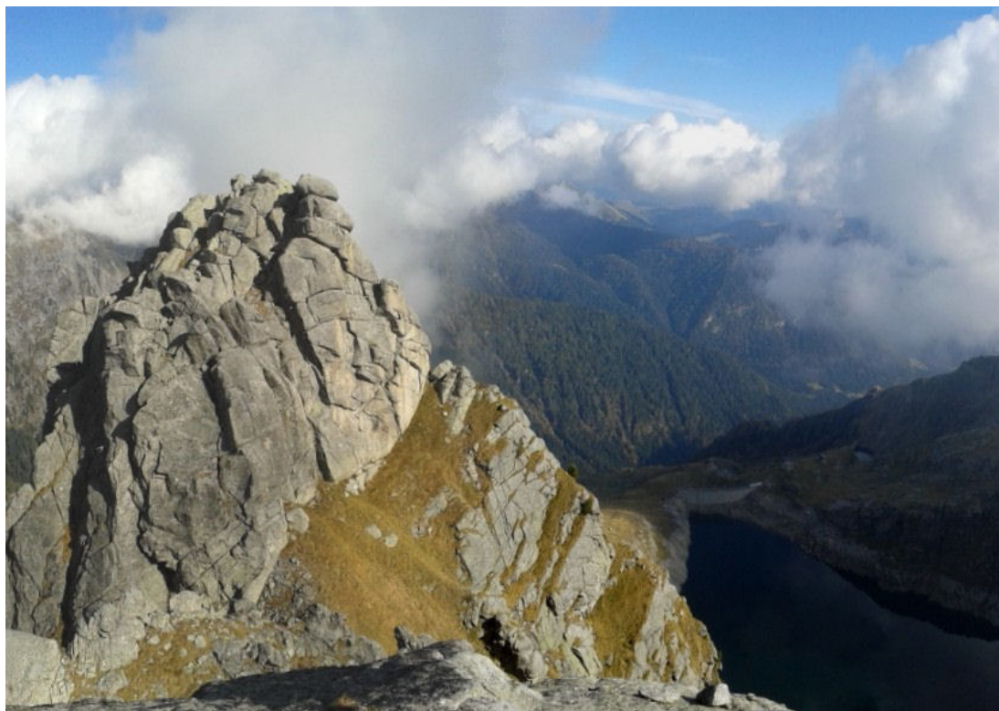
Panorama dalla vetta della II° Pala di Segura, verso la I° Pala e il lago di Costa Brunella