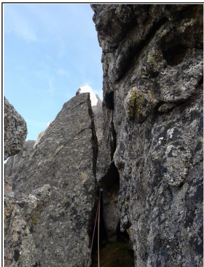
La fessura nel pilastro staccato nel 4° tiro della Via

NB: fino a questo momento le soste sono attrezzate per la calata in doppia, da qui in poi bisogna completare la via.