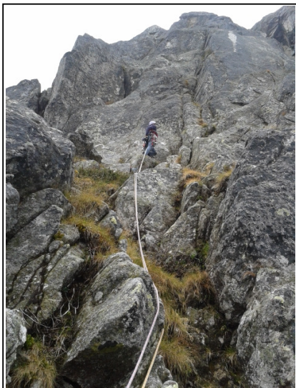
Nel secondo tiro della Via verso l'evidente diedro